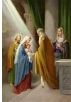
De opdracht van Jezus in de tempel

Traditiegetrouw trakteert de ouderraad met heerlijke pannenkoeken voor de kleuters. Dank je wel!