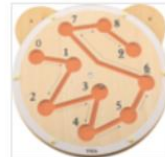
Wandspel Muurspel Klein/Rond (6 soorten) € 44,95