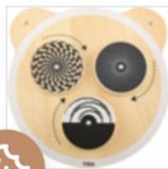
Wandspel Muurspel Klein/Rond (6 soorten) € 44,95