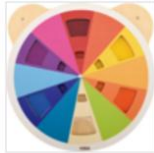
Wandspel Muurspel Klein/Rond (6 soorten) € 44,95